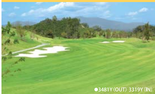
●3481Y (OUT) 3319Y (IN)

所在地: 三重県津市一志町其倉37-10 最寄IC: 伊勢自動車道・久居ICより5km