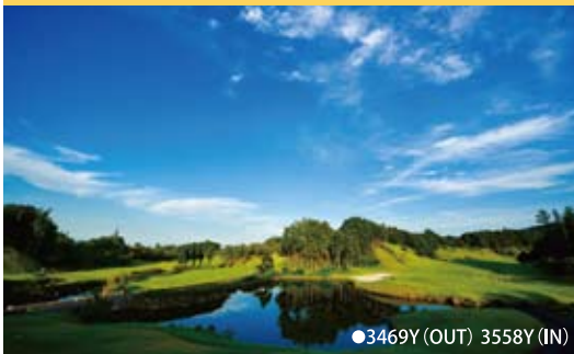
●3469Y (OUT) 3558Y (IN)

所在地: 三重県津市一志町大仰2961 最寄IC: 伊勢自動車道久居ICより10km